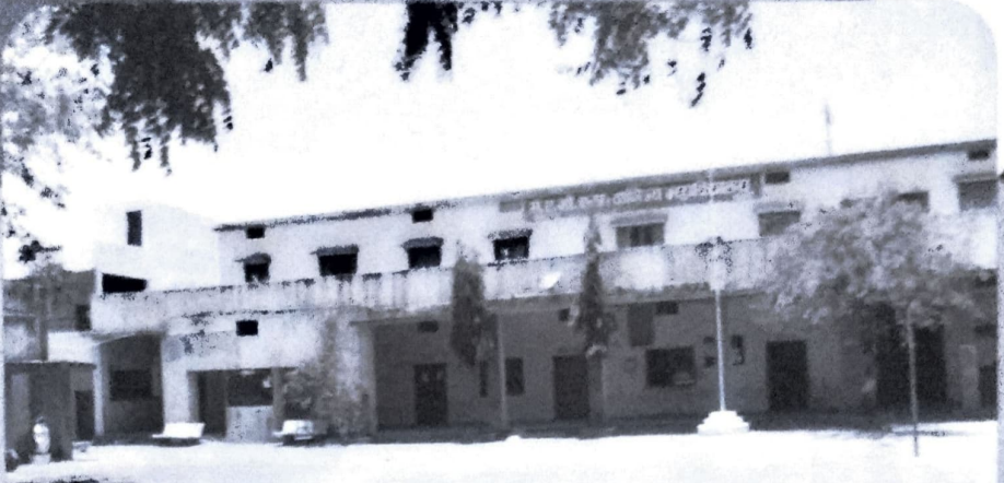
महाविद्यालयाची प्रशस्त इमारत